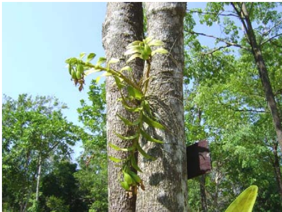
“โกมาซุม” ต้นจริงที่ได้สัมผัส เสียดยังไม่เห็นดอก