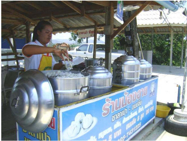
มาระนองคราวนี้ “ซึ้ง”

ดังนั้น หากจะเที่ยวจังหวัดระนอง ควรมาเที่ยวในช่วงหน้าฝนตั้งแต่เดือนพฤษภาคม เป็นต้นไป จนถึงเดือนธันวาคม จะได้น้ำตกที่สวยงามและหมอก ชมธรรมชาติ และดอกไม้ประจำจังหวัดระนองที่สวยงามนาม “โกมาซุม”