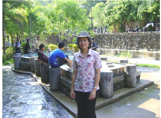
บ่อน้ำแร่ร้อนที่สวนสาธารณะรักษะวาริน