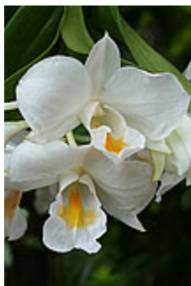
ดอกโกมาซุม