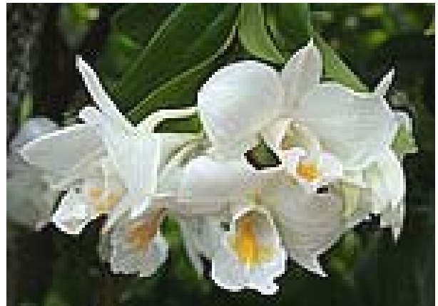
ดอกโกมาซุม หรือ เอื้องเงินหลวง