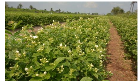
หน่วย : ลิตร (7 ซีด)/บาท

ที่มา : แผงค้าไม้ดอกไม้ประดับ ตลาดปากคลองตลาด (ขายส่ง)