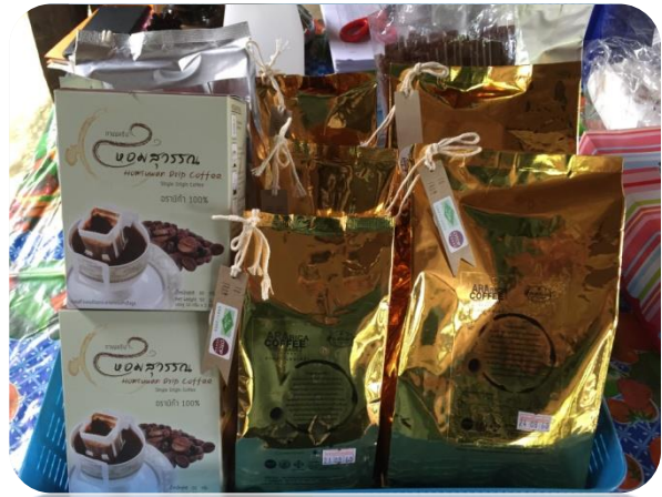
ผลิตภัณฑ์ “กาแฟเทพเสด็จ”

เขียนข่าว นางสาวอรุณ แก้วขาว ตรวจ/ร่าง นางอรรรณ วิชัยลักษณ์ ข่าวลำดับที่ ...../2561